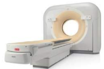
Ingenuity Core64 オランダ・PHILIPS社製

心臓ドックでは、造影剤を注射して10秒程度の息止めをするだけで、心電図からの情報を用いて狭心症や心筋梗塞の原因となる心臓の冠動脈の狭窄や閉塞を明瞭な三次元画像として描出することが出来ます。