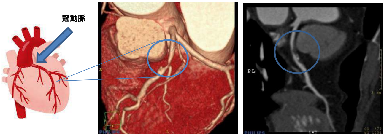
○の中の血管が狭窄部位

冠動脈CTでは心臓カテーテルを使用せず、造影剤を点滴注射することで冠動脈の走行や狭窄の形態評価ができます。心臓カテーテル検査より低侵襲で体の負担が少ない検査です。